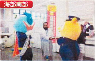
飛鳥島のJU愛知オークション会場において、外国人を対象に、自動車盗難被害防止キャンペーンを行いました。