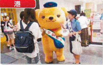
日本郵便のキャラクター「ぽすくま」と、郵便局女性職員を1日警察官に委嘱し、買い物客にニセ電話詐欺の被害防止を呼びかけました。