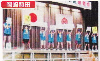
矢作北小学校で学区敬老会の皆さんを対象に、防犯少年団が、プラカードを使って特殊詐欺被害防止キャンペーンを行いました。