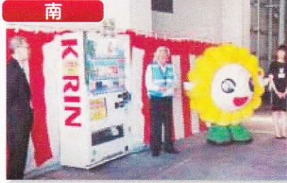
防犯支援自販機の普及を図るため、協力企業で自動販売機の設置と、お披露目式を行いました。