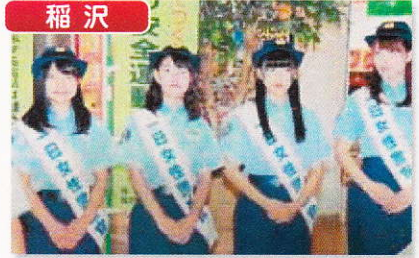
1日警察官の委嘱を受けたご当地アイドルグループ「ラヴィーナサーティ」が住宅対象侵入盗の被害防止キャンペーンを行いました。