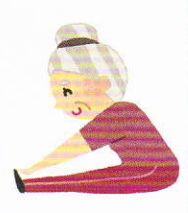
体力・運動能力調査

【主催】一宮市教育委員会 【主管】一宮市スポーツ推進委員連絡協議会 【協力】全日本ノルディック・ウォーク連盟 (ミズノ株式会社)、愛知県スポーツチャンバラ協会、 愛知県スポーツ吹矢協会 西尾張一宮支部、一宮市ショートテニス協会、 一宮市アーチェリー協会、一宮市インディアカ協会、一宮市ペタンク協会、 一宮市タスポニー協会、光明寺緑地パークゴルフクラブ、一宮市スポーツ少年団