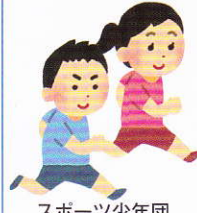
スポーツ少年団 運動適正テスト