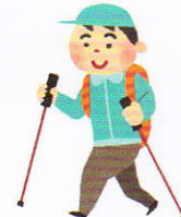
ノルディック・ウォーク体感講習会 (初心者を対象とします。)