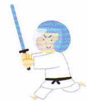
スポーツチャンバラ