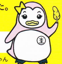
更生ペンギンのサラちゃん

しあわせ 「幸福の黄色い羽根」は、犯罪や非行のない幸福で明るい社会を願うシンボルです。