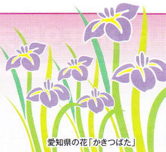
愛知の花「かきつばた」

発行所：(公社)愛知県防犯協会連合会 名古屋市昭和区円上町26番15号 (愛知県高辻センター2階) (052) 871-2110