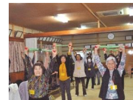
1.里小牧サロン 里の駅