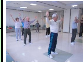
8.木曾川シルバー 健康体操サロン