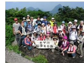
4.きそ川山歩きの会