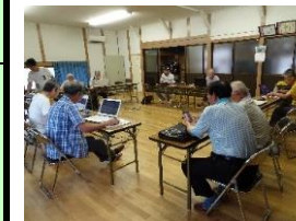
10.西割田 パソコンカフェ