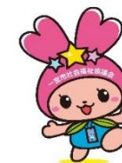
6.ボランティアセンター