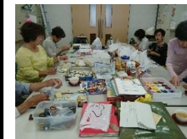
7.木曾川ほっぺの会