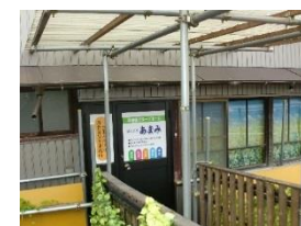
5.福祉工房出会いサロン