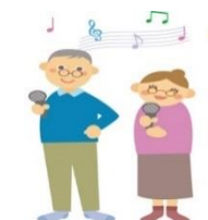
5.福祉工房出会いサロン