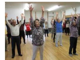
9.西割田ふれあいサロン