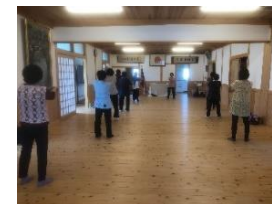
7.東割田生き生きサロン