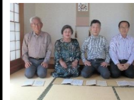
5.木曾川謡曲クラブ