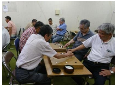
囲碁サークルの様子