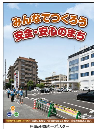
県民総ぐるみ運動スローガン「犯罪にあわない」「犯罪を起こさせない」「犯罪を見逃さない」

この運動は、県民一人一人が防犯意識を高め、県民総ぐるみの安全なまちづくり活動を広く県民運動として推進し、犯罪を起こさせない環境作りに取り組むことにより、安全に安心して暮らせる社会の実現を目指すものです。