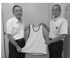
中日本ボクシング協会 東会長(写真右側)