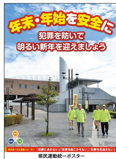
県民運動統一ポスター