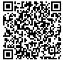
木曽川公民館チャンネル