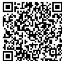
木曾川公民館チャンネル